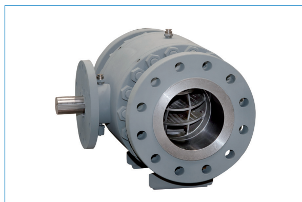
Valvola trunnion con trim di regolazione - Trunnion ball valve with regulation trim.